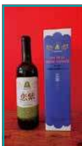
町特産の山葡萄 「山葡萄ワイン」 8千円～