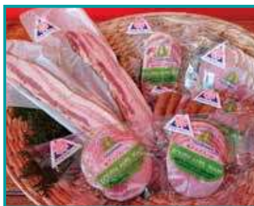
山梨県産豚肉使用 「ハムセット」 1万5千円～