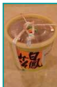
手作り味噌 「白鳳味噌」 5千円～