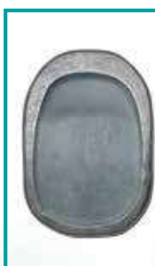
多くの書家に 愛用されている 伝統工芸品 「雨畑真石硯」 3万4千円～