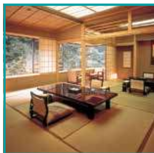
世界最古の温泉旅館 「西山温泉慶雲館宿泊券」 22万円～