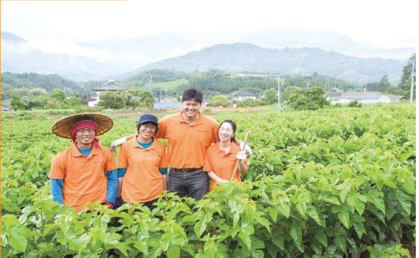
山梨県農業まつり式 29年 10月 13日 山梨県農業まつり実行委員会・山梨県