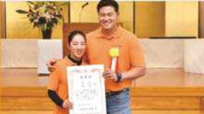
山梨県知事賞 農業を育てるナイスカップル賞受賞